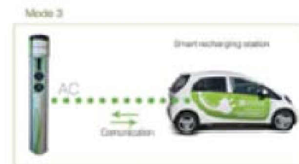
MODE 3 ΑΜΦΙΔΡΟΜΗ ΕΠΙΚΟΙΝΩΝΙΑ ΑΥΤΟΚΙΝΗΤΟΥ/ΦΟΡΤΙΣΤΗ