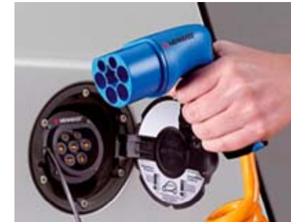
ΤΥΠΟΣ 2 (φόρτιση AC) 3/7/21kW