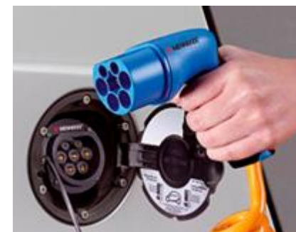
ΤΥΠΟΣ 2 (Φόρτιση AC) 43kW max