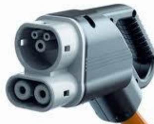
COMBO (Φόρτιση DC) 100kW max