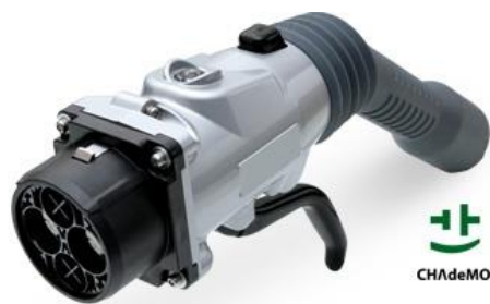
CHAdeMO (Φόρτιση DC) 50kW max